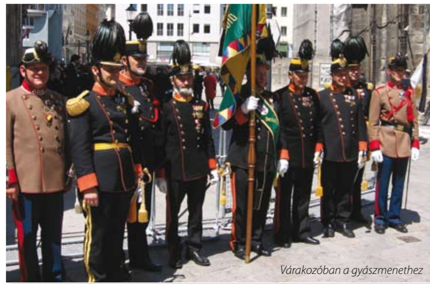
Várakozóban a gyászmenethez