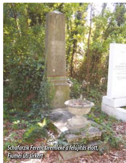
Schafarzik Ferenc síremléke a felújítás előtt, Fiumei úti sírkert