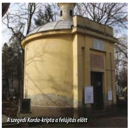
A szegedi Korda-kripta a felújítás előtt