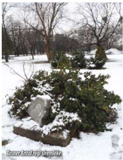
Tasner Antal régi síremléke