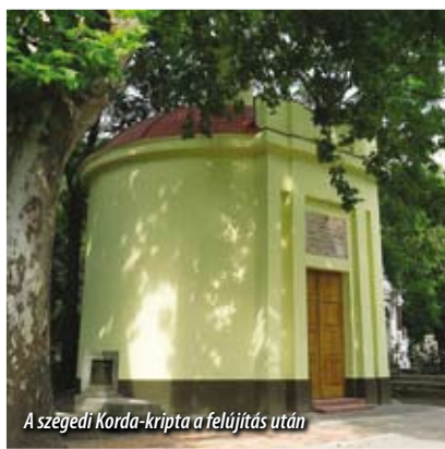
A szegedi Korda-kripta a felújítás után