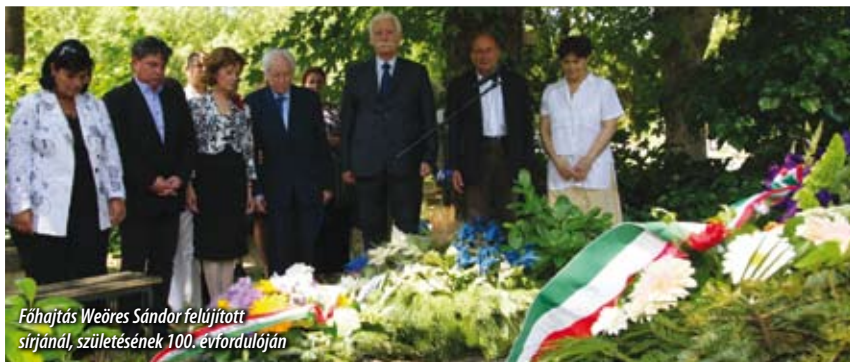
Főhajítás Weöres Sándor felújított sírjánál, születésének 100. évfordulóján

Weöres Sándor sírjánál emlékezett meg a Magyar Írószövetség, a Nemzeti Örökség Intézete, valamint a Nemzeti Emlékhely és Kegyeleti Bizottság a költő születésének 100. évfordulója alkalmából a Farkasréti temetőben. Kalász Márton Kossuth-díjas költő kiemelte: Weöres pályája irodalomtörténetileg feltártnak mondható, művei jó kiadásokban hozzáférhetők,