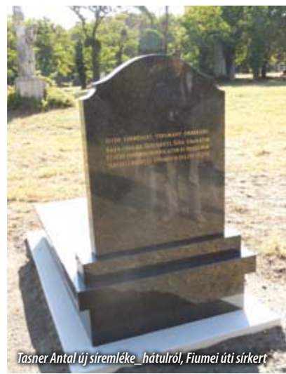
Tasner Antal új síremléke _hátról_, Fiumei úti sírkert