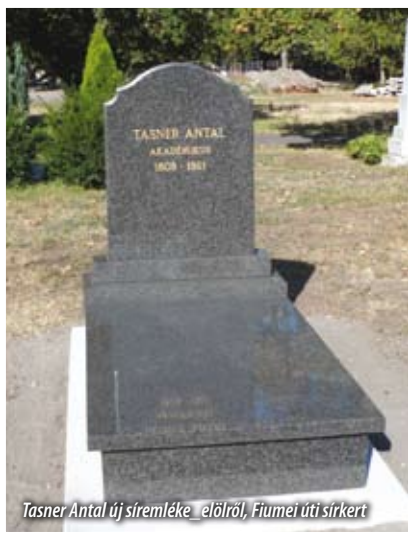
Tasner Antal új síremléke _előlről_, Fiumei úti sírkert